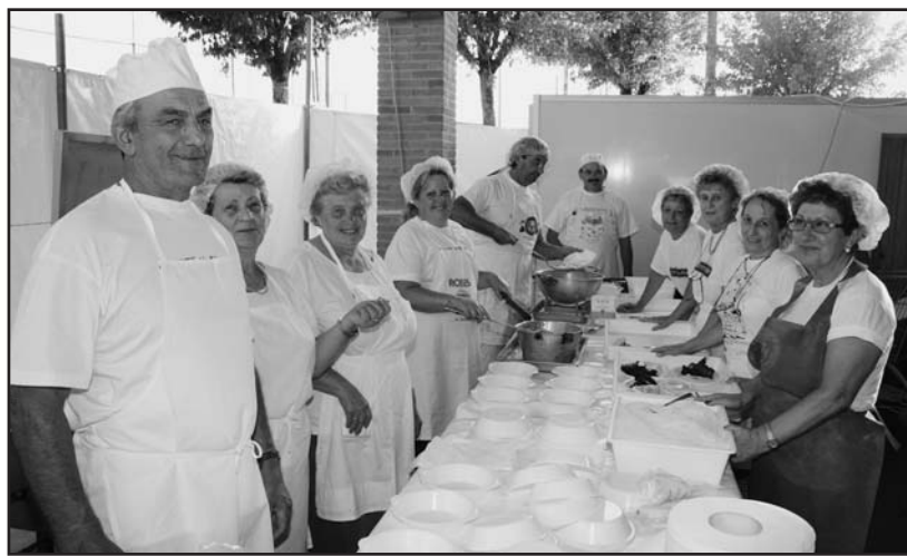
Volontari di S. Giustina sempre con il sorriso.

Tenendo conto che queste manifestazioni si svolgono prin-