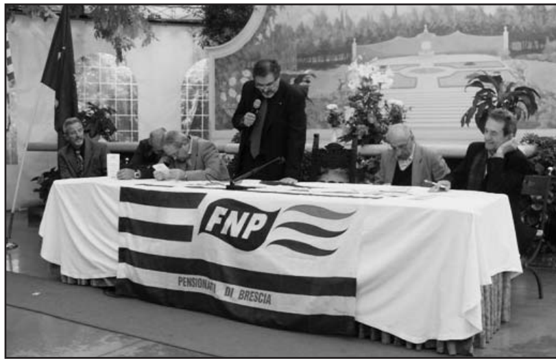
Un momento della passata edizione.

"Un passato che non può e non deve essere dimenticato dei Pensionati della Cisl", dicono gli organizzatori di questo importante appuntamento, che si ripete ogni anno. Per ritrovarsi a discorrere dell'oggi e del passato. Un passato che non è solo memoria, ma parte della storia di ognuno, e nello stesso tempo dei propri