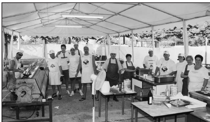
A S. Giustina gli "anziani" sono punto di riferimento per i giovani.