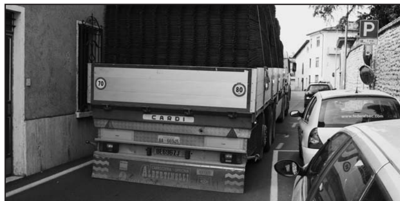
Traffico pericoloso in via A. Mazzoldi.

Solo il tracciato prima delle elezioni... e dopo