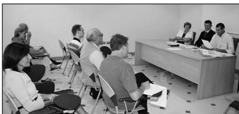
I partecipanti alla conferenza stampa.