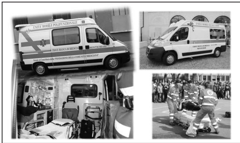
Alcuni dei servizi della Croce Bianca di Montichiari.

La sede della Croce Bianca a Montichiari è in via Arrighini tel 0309651679, infoline 3388740415.