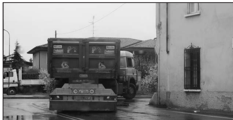
Automezzo all'incrocio del "Cantoncino" nel centro del paese.